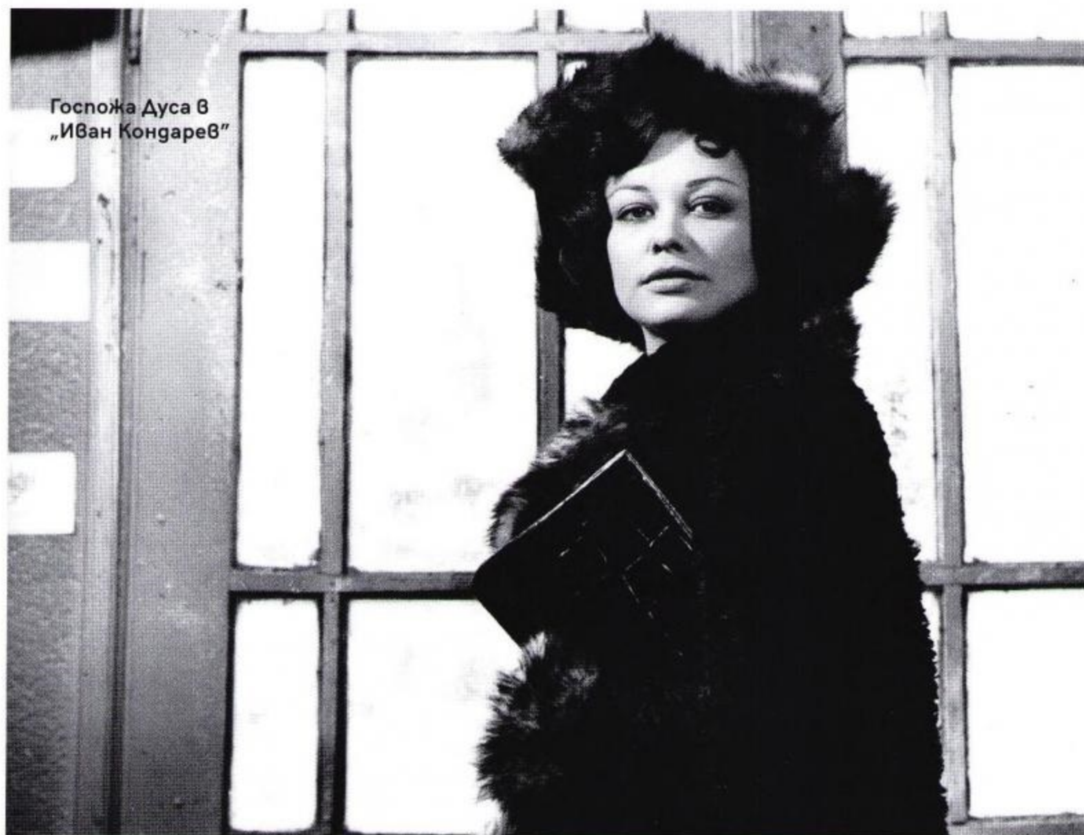
Госпожа Дуса в „Иван Конгарев“