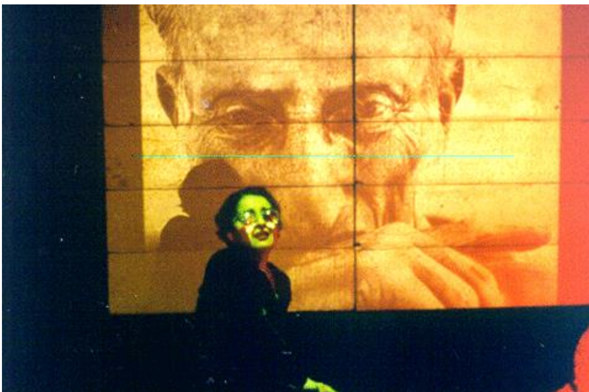
Снимка от спектакъла „Алтийско сияние“, 1997г.,НДК,София

Изброените приноси са резултат от дългогодишната ми работа в академичната и театрална среда на НБУ. Те са следствие не само на моите индивидуални усилия и постижения, но и на общата работа и търсения на колегите и студентите от департамент „Театър“. Работата на актьора и преподавателя по актьорско майсторство е отворена за развитие във времето, поради което постиженията и приносите в определен момент се явяват основа и предпоставка за нови търсения, проекти и постижения.